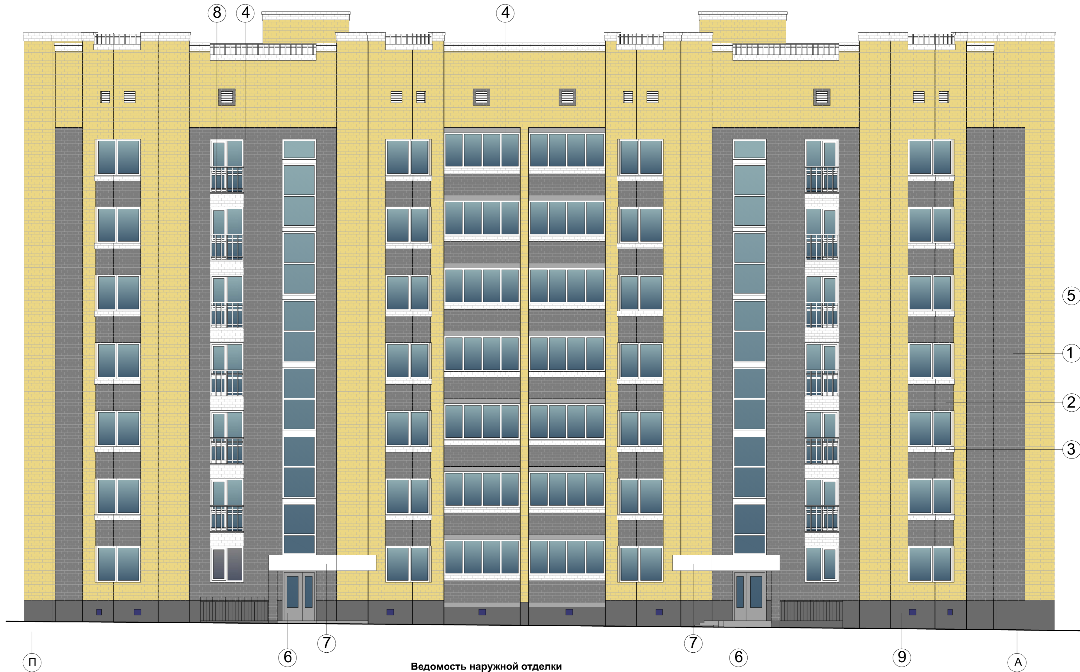
Ведомость наружной отделки