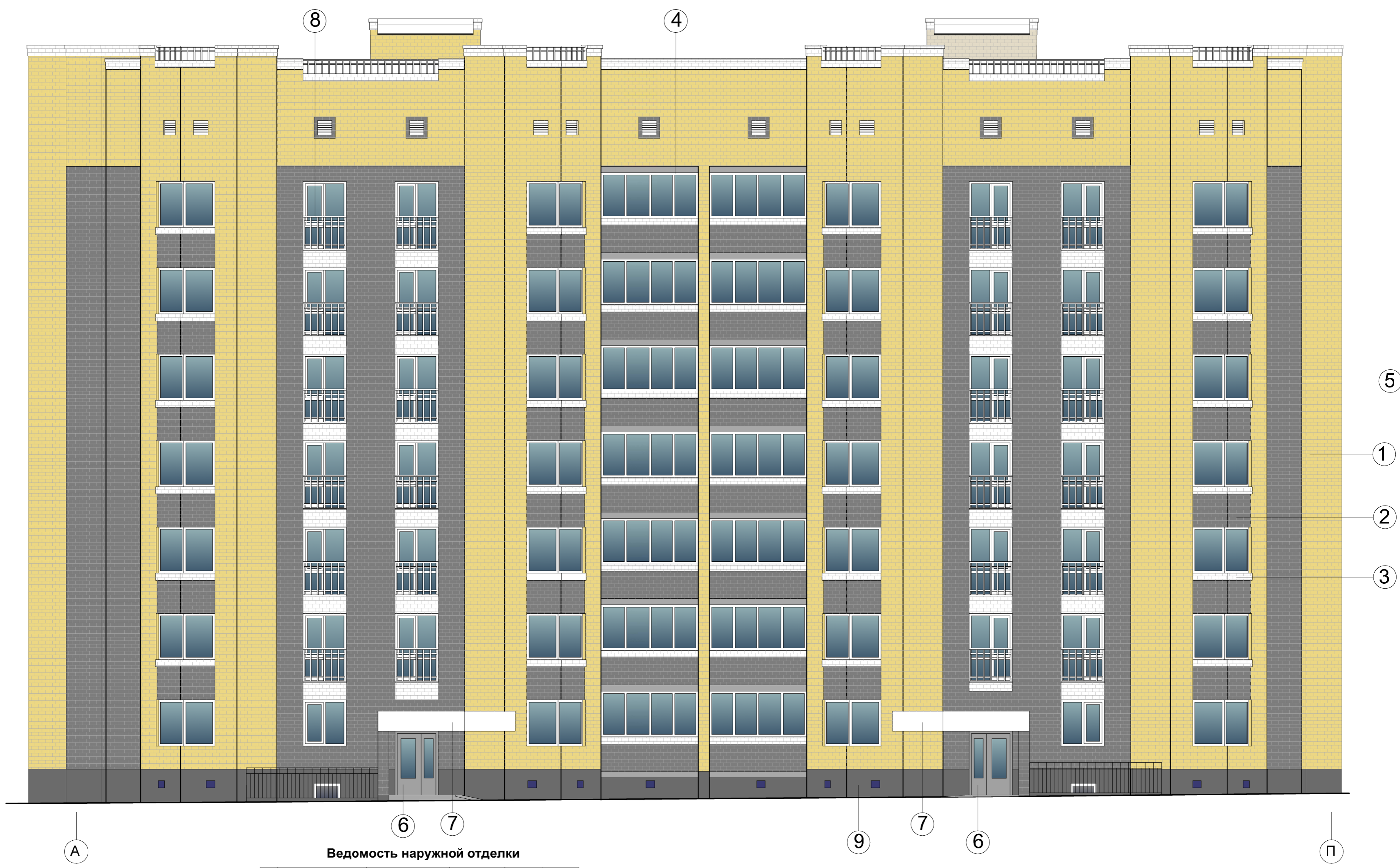
Ведомость наружной отделки

Согласно Взам. инв. № Подл. и дата Инв. № подл.